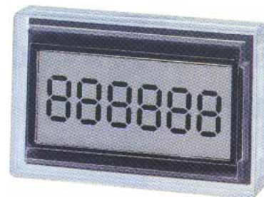
EA TM-7016 (ohne Rahmen)