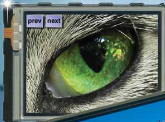
3.2" EA eDIPTFT32-ATP