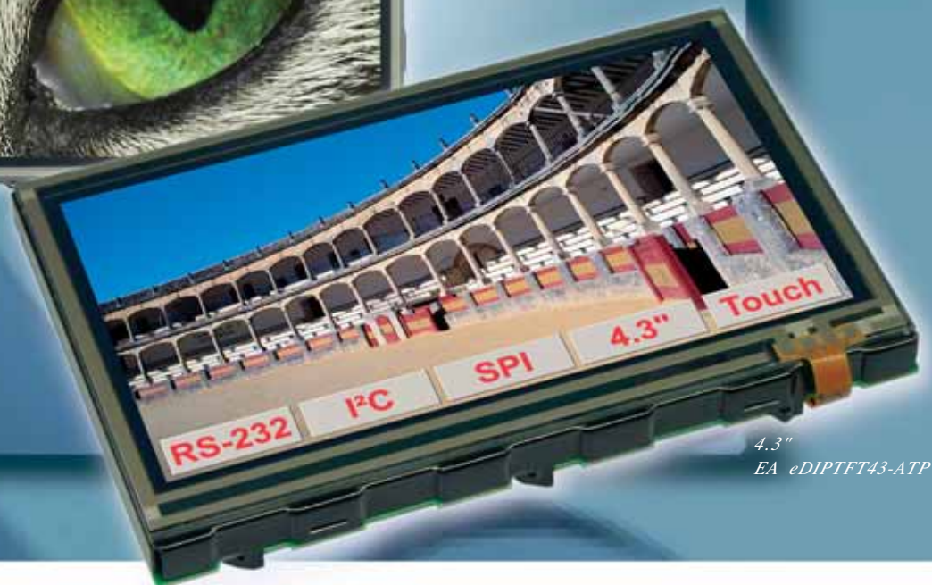
4.3" EA eDIPTFT43-ATP